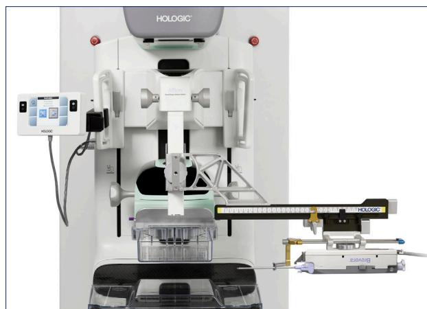
Système de guidage pour biopsie mammaire en Affirm avec bras latéral Affirm

Le système de guidage pour biopsie mammaire en position verticale Affirm est conçu pour s'intégrer à n'importe quel système de mammographie 3Dimensions™ ou Selenia® Dimensions®, vous offrant ainsi une procédure de biopsie rapide et efficace. 2 De plus, l'accessoire Affirm Lateral Arm améliore votre accès à un large éventail de lésions difficiles à atteindre, vous permettant ainsi de les traiter rapidement, facilement et en toute confiance. 2,8